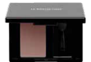
Magic Shadow 51 Pale Mauve

Magic Shadow 51 Pale Mauve umspielt den Blick und unterstreicht die souveräne, in sich ruhende Präsenz des Looks.