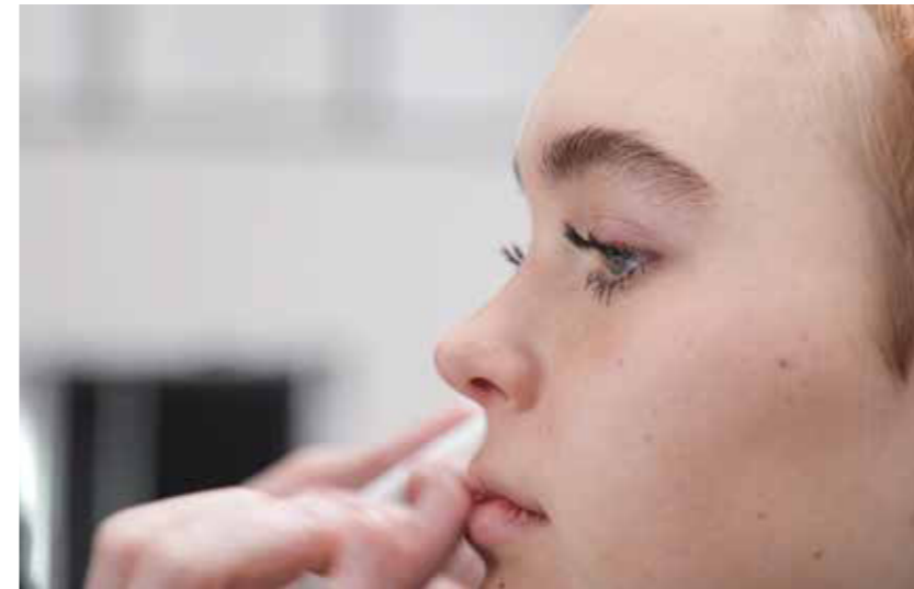
SANFT UND SUBTIL Ein Hauch von Farbe und Glow.

« In dieser Kollektion feiern wir die wahre Selbstliebe. Neben Natürlichkeit betonen wir Charakter, Individualität und Persönlichkeit. Die Haarschnitte und Haarstylings sind Ausdruck für unser Wohlbefinden. Auf absolut authentische und inspirierende Weise unterstützen und verstärken sie die natürliche Schönheit und das Selbstbewusstsein der unterschiedlichen Charaktere. »