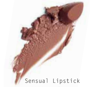
Sensual Lipstick G333 Cashmere