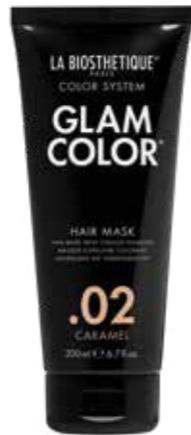
HOME CARE: Glam Color Hair Mask .02 Caramel