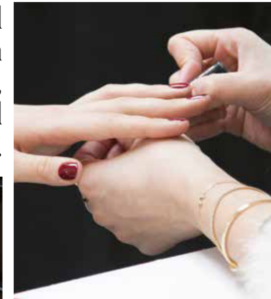
STARKES STATEMENT Die Anziehungskraft des tiefroten Nagellacks.