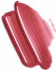
Cream Gloss Pinky Nude

Charakterkopf. Harmonisch unkonventionell: Unterschiedlich geschnittene Längen am Oberkopf erzeugen eine weiche Form, die durch warme Blond-Karamell-Nuancen unterstützt wird. Die Glam Color Haarmaske frischt den Glow der Haarfarbe ganz einfach zuhause wieder auf, sodass sie mit dem Make-up in durchscheinenden, schimmernden und glossigen Rosétönen um die Wette strahlt.