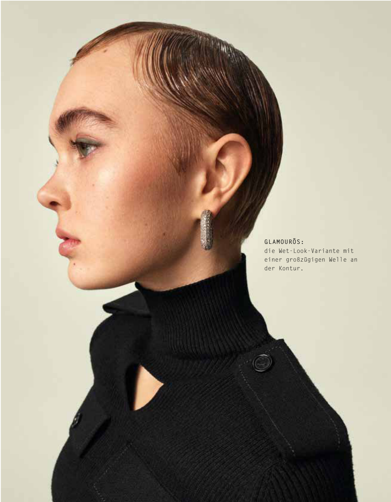
GLAMOURÖS: die Wet-Look-Variante mit einer großzügigen Welle an der Kontur.