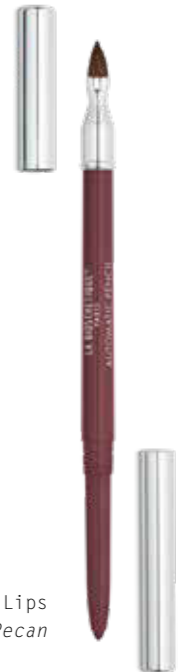
Automatic Pencil for Lips LL38 Pecan